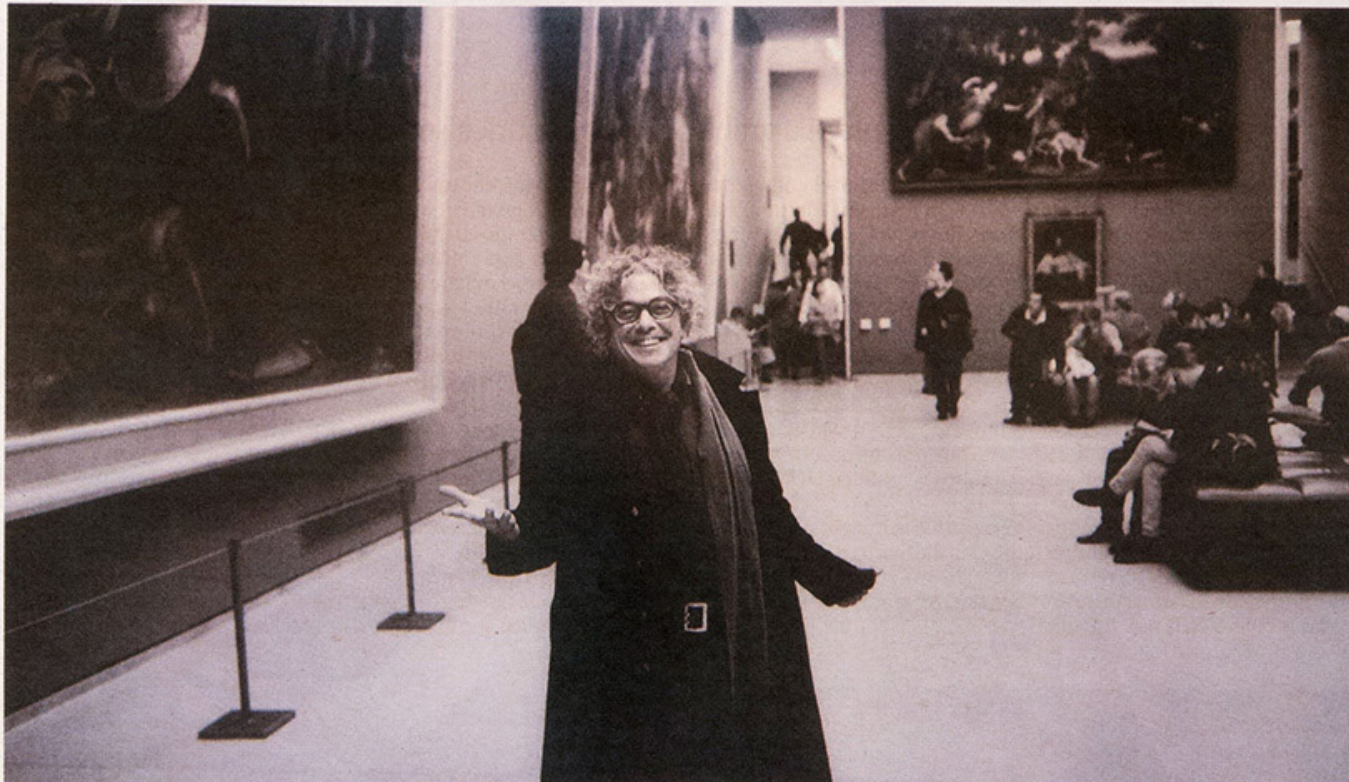
Alécio de Andrade en una de sus fotografías sobre el Museo de París.