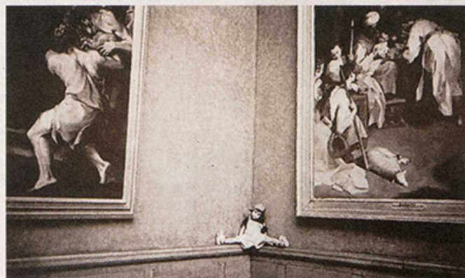
Una de las obras de la muestra.