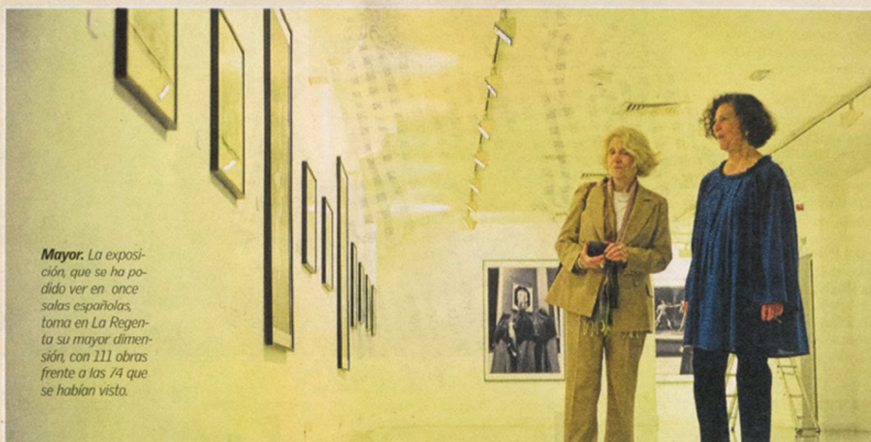
Mayor. La exposición, que se ha podido ver en once salas españolas, toma en La Regenta su mayor dimensión, con 111 obras frente a las 74 que se habían visto.